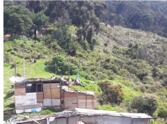
Fotografías de casas en el Barrio el Triángulo. Tomadas en enero 2020.