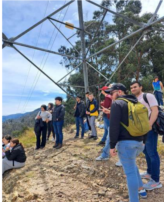
Figura 3. Evidencia Actividad Taller de Educación Ambiental dirigido a estudiantes de la U. Piloto.

Como se detalla en la anterior ficha, la actividad correspondió a una duración de 20 minutos, y fue realizada en la parte alta de la RUCH, junto a la antena que marca el límite alto del predio. Ver Figura 3.