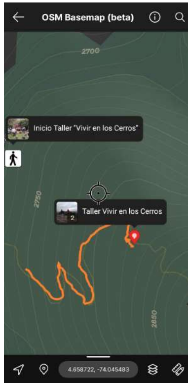
Figura 20. Registro de Información Geográfica en App Avenza Maps - Atlas.