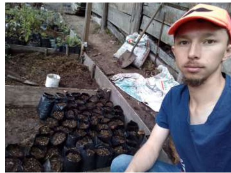
Figura 8. Evidencia Voluntariados 5