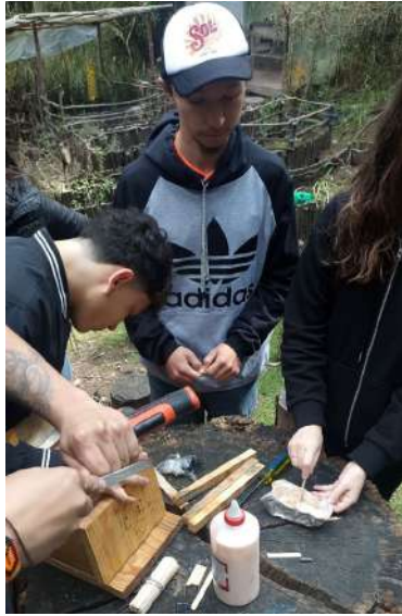
Figura 4. Evidencia Voluntariados 1