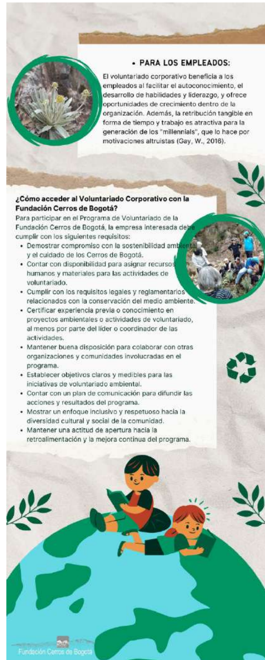
Figura 11. Infografía Voluntariado Corporativo 2