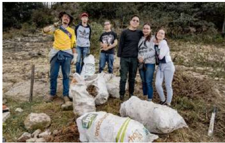
Figura 5. Evidencia Voluntariados 2