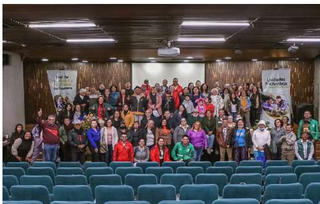
Figura 2. Evento Inaugural Chapinero Siembra Esperanza.

el reciente robo - saqueo al cuarto de herramientas el cual sucedió en la RUCH dos días antes. (Figura 2)