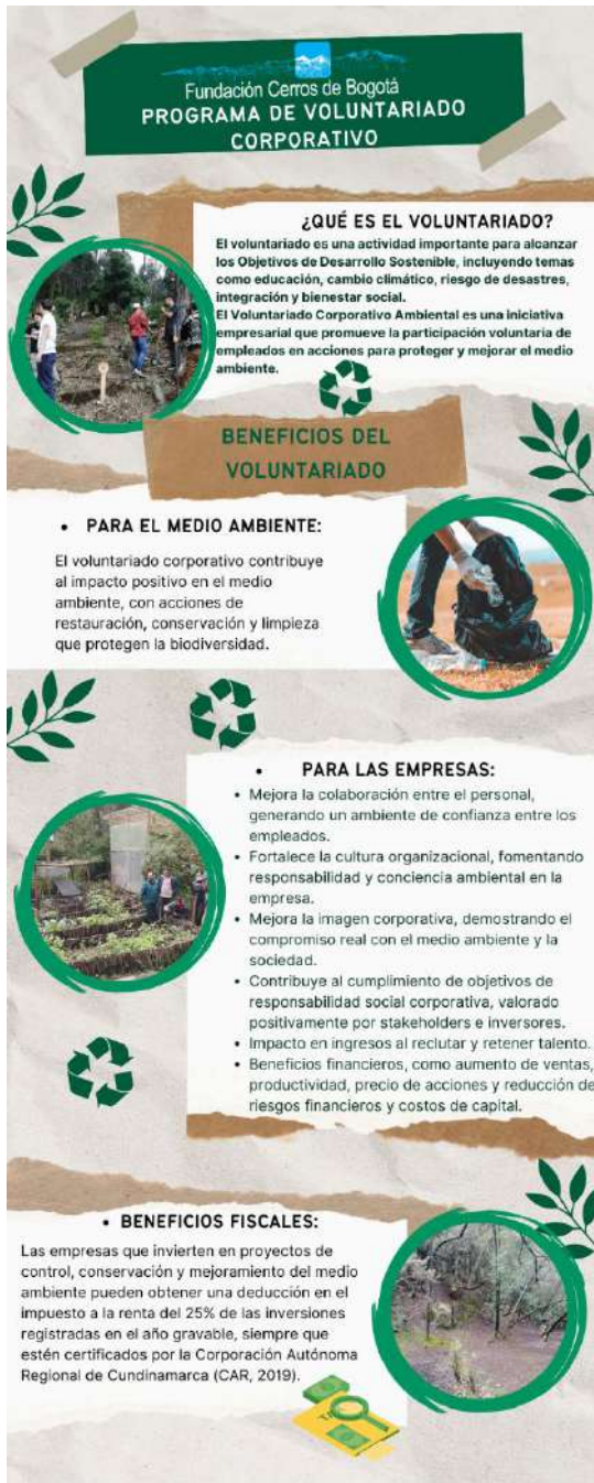
Figura 10. Infografía Voluntariado Corporativo 1.