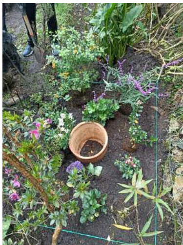
Figura 6. Evidencia Voluntariados 3