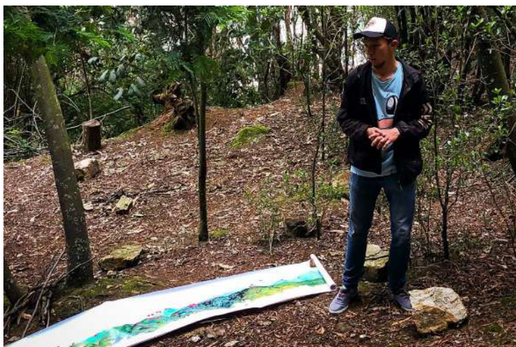
Figura 18. Cátedra Cerros de Bogotá - Patrimonios Vivos en los Cerros.

Sobre las 10:10 se dió cierre a la actividad invitando a los asistentes a estar atentos a las redes sociales para participar en las actividades de los proyectos. (Figura 18)