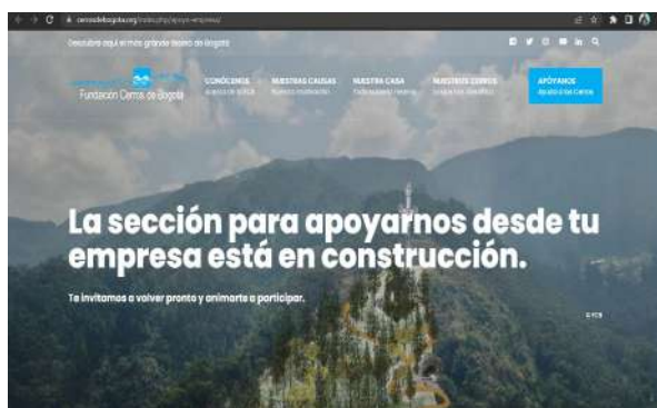
Figura 9. Estado Actual del Voluntariado Corporativo en la Fundación Cerros de Bogotá.

En la actualidad, la FCB requiere establecer un Programa de Voluntariado Corporativo en el que se invite a estas organizaciones y otras nuevas para que se interesen en realizar Donaciones, apadrinamientos o participar en jornadas de voluntariado, según las características que prefieran, con el fin de que estas dejen huella en la recuperación de los Cerros Orientales en el marco del compromiso social y ambiental que este tipo de actividades puede demostrar. Como se evidencia en la figura 9, se observa que, en la Página Web de la FCB, actualmente no se lleva a cabo este tipo de voluntariado bajo un modelo o programa estructurado. Para ello, a continuación, se plantea dicho programa, como propuesta para publicación en la página web y su aplicación futura.