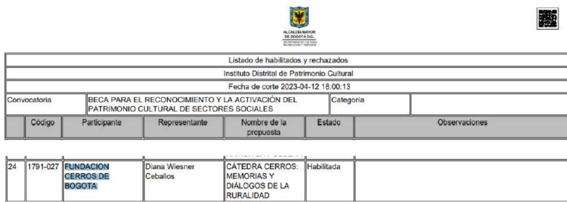
Figura 12. Listado de habilitados y rechazados 1.

El día 5 de abril, el IDPC publicó el listado de habilitados, rechazados y documentos a subsanar para las dos convocatorias, encontrando que, en las mismas, la fundación fue reportada con estado Habilitada. Ver Figura 12 y Figura 13, correspondientemente.