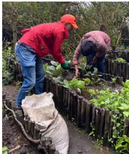
Figura 1. Labores en la Huerta La Lupita.