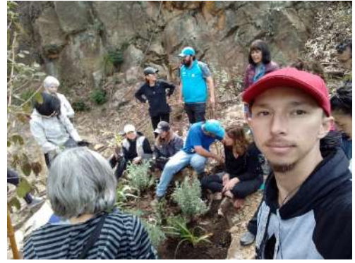
Figura 7. Evidencia Voluntariados 4